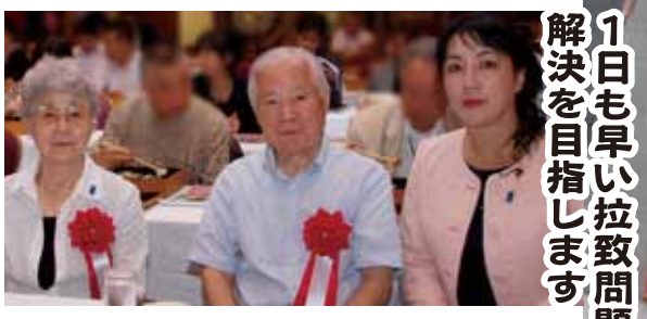
横田夫婦を十年来支援