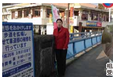
六浦六号橋の歩道拡幅工事了!