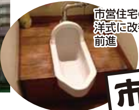
市営住宅の和式のトイレを洋式に改善するために一歩前進