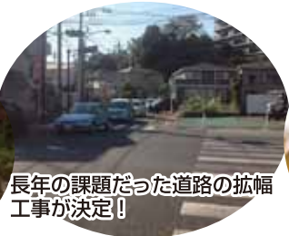
長年の課題だった道路の拡幅工事が決定!