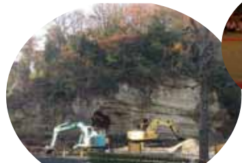
教育委員会が管轄している土地にある穴にフェンスを作るよう働きかけました