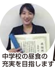
中学校の昼食の充実を目指します