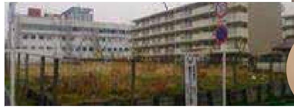
内川県営住宅跡地を公園にする為に、地元の方々と共に市に働きかけ実現へ。