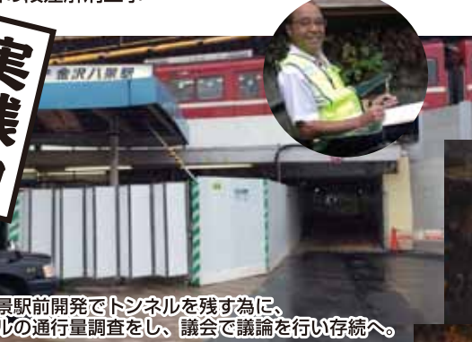
金沢八景駅前開発でトンネルを残す為に、トンネルの通行量調査をし、議会で議論を行い存続へ。