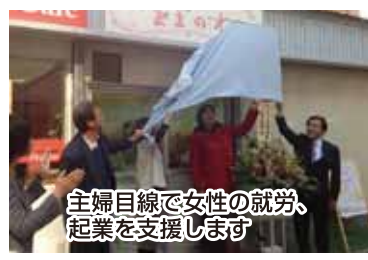
主婦目線で女性の就労、起業を支援します

横浜市議員84名中 自民党32名 そのうち 女性2人 もっと、もっと女性の声を議会へ届けたい