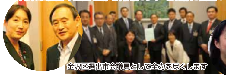
金沢区選出市会議員として全力を尽くします