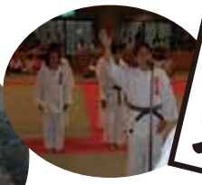
横浜市立武道館建設を目指して議会で議論中